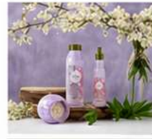
GLANS & KLEUR