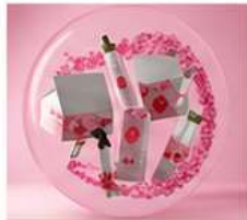
HAARUITVAL & VERZWAKT