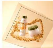
DROOG & GEVOELIG