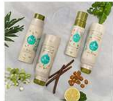
ROOS & TALG